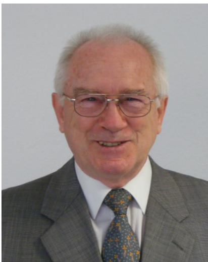
Gastdirigent Günter Krause