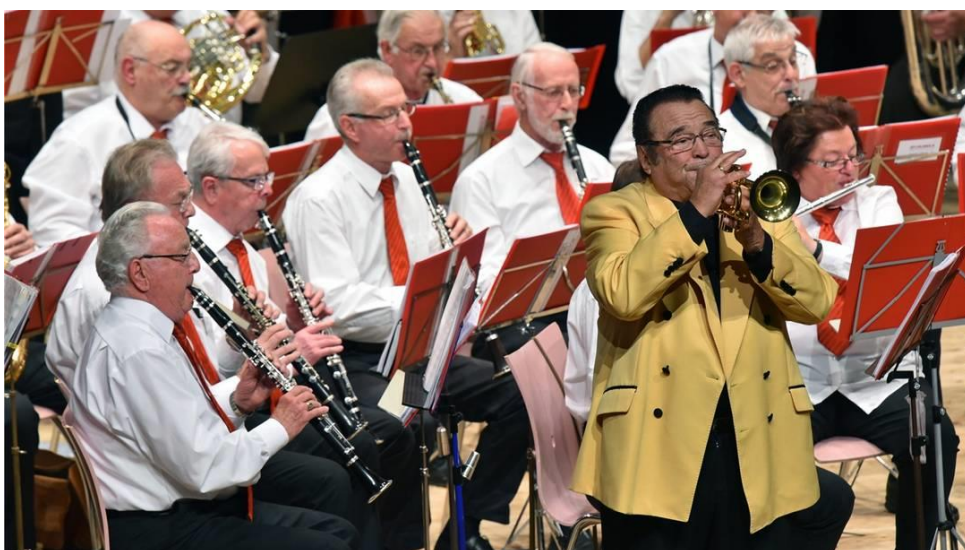
Veteranenspiel Kanton Solothurn 2015